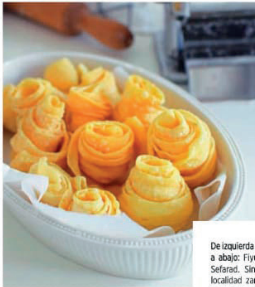
De izquierda a derecha y de arriba a abajo: Fiyuelas de Sabores de Sefarad. Singular caserío en la localidad zaragozana de Tarazona. Simbología en la cocina judía medieval (cribadas en Cerámica Saedile). Y carpaccio de calabacín y falafel en el restaurante Casa Mazal de Córdoba, con sus abundantes propuestas kosher.