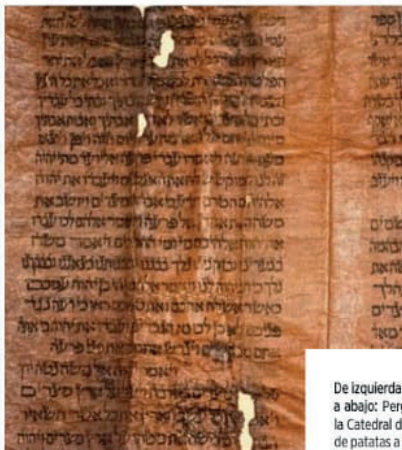
De izquierda a derecha y de arriba a abajo: Pergamino de la Torá en la Catedral de Calahorra. Duquesa de patatas a la importancia en salsa verde con borraja (Restaurante Treintaitrés de Tudela). Cebollas estofadas glaseadas (Restaurante Topero de Tudela). Talla gótica en la capilla de Santa Ana en la Catedral de Tudela.