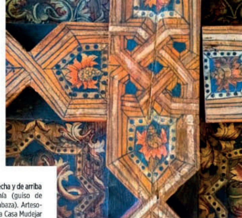
De izquierda a derecha y de arriba a abajo: Alboronía (guiso de berenjena con calabaza). Artesonado en la Hotel La Casa Mudéjar de Segovia. Filikas sefardíes en el restaurante El Fogón Sefardí, situado en el mismo hotel. Y personaje supuestamente judío en la portada de la iglesia del Santo Sepulcro de Estella-Lizarra.